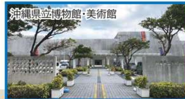
沖縄県立博物館・美術館